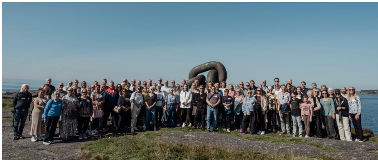
Deltakerne på Kielland-treffet ved minnesmerket «Brutt lenke» i 2023.

Det faglige programmet bød også på et foredrag fra Nasjonalt kunnskapssenter om vold og traumatisk stress (NKVTS) om helsemessige konsekvenser av katastrofer, med konkrete anbefalinger for oppfølging av overlevende og pårørende. Dette ble fulgt av gruppebaserte samtaler og en sesjon i plenum. På seminarets siste dag ble det lagt til rette for individuelle samtaler med forskningsrepresentanter fra NKVTS, og intervjuer til Minnebanken i samtaler utført av ansatte ved UiS og prosjektleder.