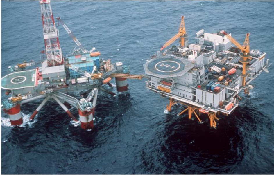
Boligplattformen «Alexander L. Kielland» (til høyre) før ulykken. «Alexander L. Kielland» av NTB Scanpix. Gjengitt med tillatelse